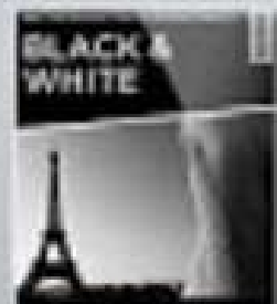
BLACK & WHITE