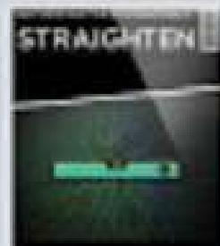
Straighten & Rotate